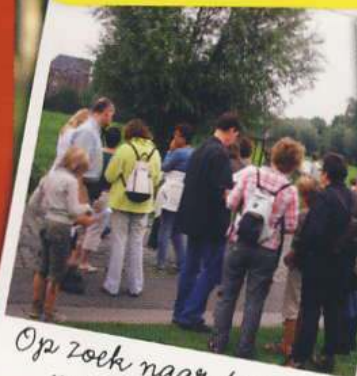
Op zoek naar de schat van Oude Bareel