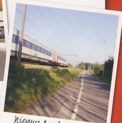
Nieuwe topplaag met grassdallen in de bermen