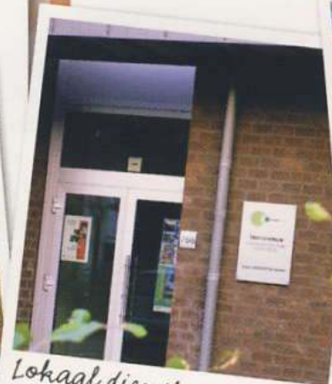
Lokaal dienstencentrum Wibier