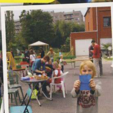
Volksspelen in de Draversstraat

Sinds 2006 zijn er 29 goedgekeurde activiteiten doorgegaan in de Sint-Amandsberg. Hier vindt u enkele inspirerende voorbeelden: