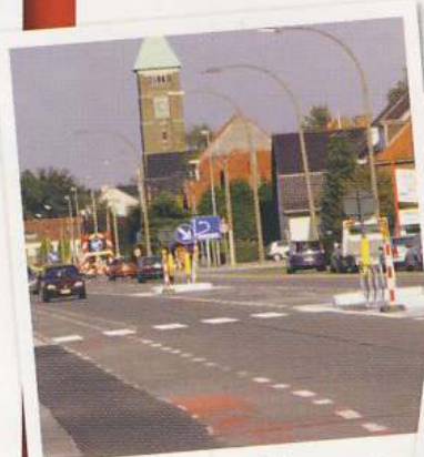
Veiliger oversteken op de Antwerpsesteenweg

Vernieuwen topplaag: Schoolstraat, Pijkestraat en deels Hogeweg.